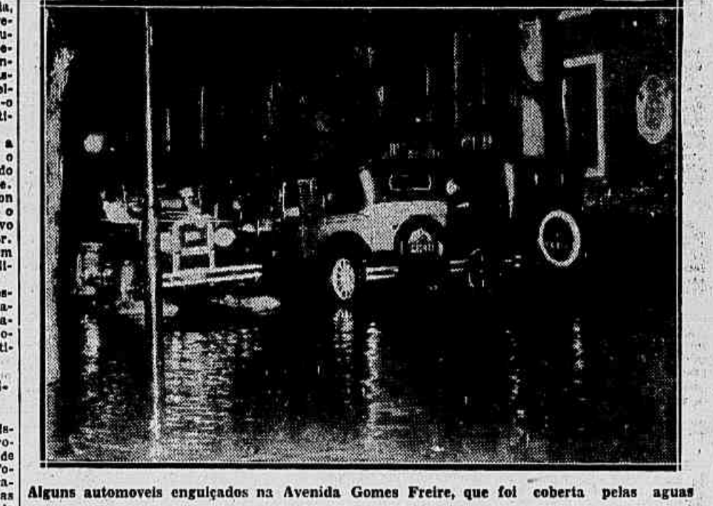
Alguns automoveis engulhados na Avenida Gomes Freire, que foi coberta pelas aguas

O temporal que desabou á noite encheu, como de habito, as ruas da cidade. Varias se tornaram inteiramente intrançaveis, paralyzando o trafego de bondes e impedindo o transitio aos pedestres. Um dos logradouros publicos, que o effeito do temporal mais forte se fez sentir foi a Avenida Gomes Freire. A agua subiu acima do passeio, ameaçando de invasão os predios ali localizados. Ruas transversaes se viram, por igual, em condições idênticas. Entre estas, a do Senado, que ficou intrançavel. É claro que o trafego de bondes, paralyzado, só se fez após algum tempo. Só depois de 10,30 da noite que o serviço de bondes foi normalizado.